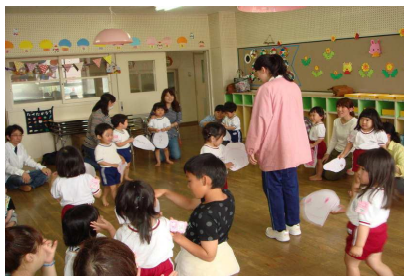
年少組 「親子でゲームをしよう」