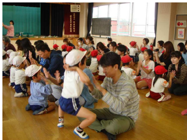
年中組 「親子でゲーム遊びをしよう」