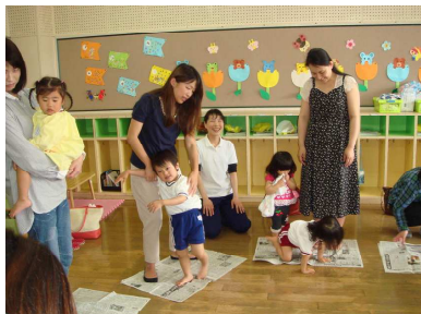
幼小組 「親子で手遊びやお遊戯をしよう」

日増しに夏の装いに変わる中、5月16日(土)に恒例の「親子レクリエーション」と「父母の会総会」が実施されました。レクリエーションの部では、各学年とも工夫されたプログラムで大いに盛り上がりました。お父さんもお母さんも童心に返って、お子様と一緒に汗をかいておられる姿に感動しました。お疲れ様でした！