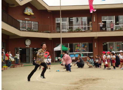
年長組 「親子で遊ぼう」

父母の会総会の部では、新役員の紹介並びに今年の活動計画が話し合われました。特に会員数が減少している中での工夫点として、主な園行事や活動（友愛セール・ベルマーク整理・餅つき大会）にクラスサポーター制が提案され、役員以外の方で都合がつく日での活動に参加をお願いすることになりました。会員の皆様の、ご支援とご協力をお願いいたします。