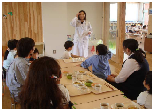
栄養士さんから努力している事柄を聞く