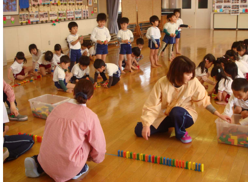
お友だちと学び合いも始まりました

気持ちのよい風が吹き、早くも新緑若葉の季節を迎えています。桜の季節から3週間も経たない中で、初夏の気配です。子どもたちも、入園・進級を経て少しずつ周囲の環境にも慣れて元気いっぱい新しい1年をスタートしています。