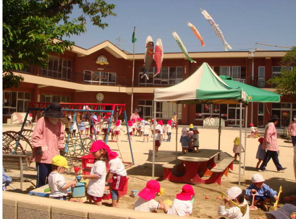
お日さまのもとで、仲良く楽しく遊んでいます