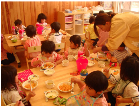
おいしい給食も始まりました