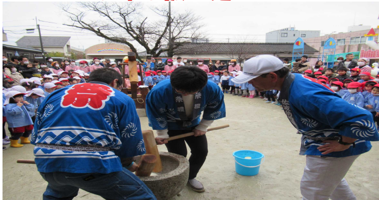
第46回 お餅つき大会