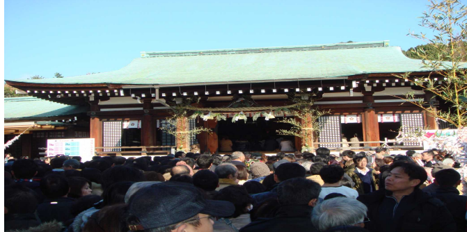
今年1年の幸せを願う (防府天満宮 初詣)

新年明けましておめでとうございます。ご家族揃っての希望に満ち溢れた、新しい年を迎えられましたことを心からお慶びを申し上げます。