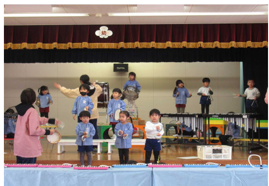
生活発表会の練習を頑張る子どもたち (1/25)

3学期は、登園日数が50日余りと短く、この1年間を振り返ったり、進級・進学に向けた新しいめあてを考えたりする期間となります。とりわけ年長学年は、小学校1年生に向けて、道路の横断の仕方や交差点での信号機を使つての歩行の学習したり、小学校へ遊びに行つて雰囲気慣れたり、牛乳給食を実施したりして新しい生活環境に適応するための学びをします。また、4月からの登校・下校時の安全の確保に向けて交通安全や親子登校の機会も設定されます。